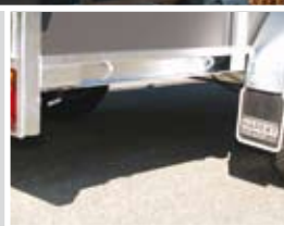
▲ Bindhaken en uitzetsteunmontage plaatjes aangelast