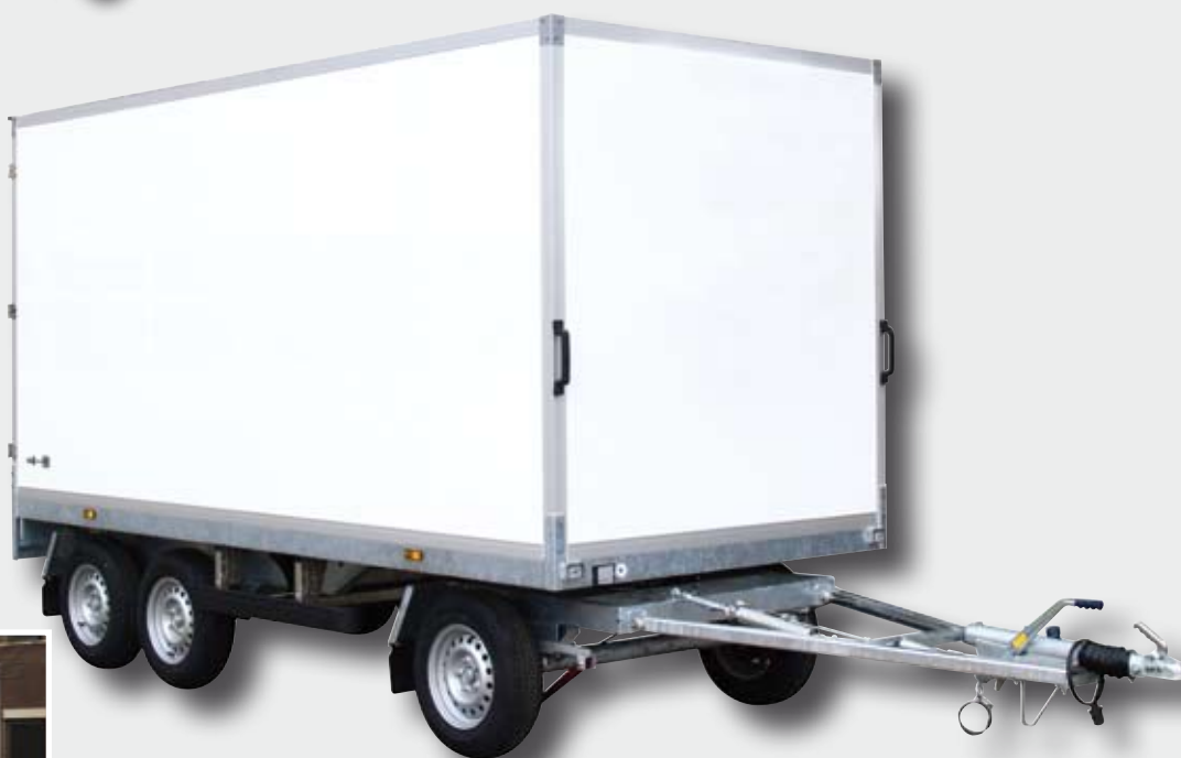
◀ Optie: Verschillende soorten ramen/vensters mogelijk

HAPERT staat al vele decennia voor betrouwbare kwaliteit. Voor hoogwaardige materialen en onderdelen. Voor doordachte ontwerpen. Voor kwaliteitsproducten zijn die zichzelf keer op keer bewijzen onder de meest uiteenlopende omstandigheden. HAPERT-schamelwagens zijn in veel Europese landen verkrijgbaar via professionele dealers met veel kennis van de producten en persoonlijke betrokkenheid bij het merk en de organisatie. De basisuitvoeringen van alle schamelwagens met gesloten opbouw zijn al zeer compleet uitgerust met twee achterdeuren voorzien van RVS hang- en sluitwerk en dito bevestigingsmaterialen! Neem contact op met uw HAPERT-dealer in de buurt of kijk op WWW.HAPERT.COM en laat u informeren over de vele extra accessoires en opties. Natuurlijk is de schamelwagen met gesloten opbouw ook leverbaar met zijdeur, zijklep, rolluik en/of achterklep met anti-slip coating. Ook kunt u kiezen voor een extra koelaggregaat, spoiler of afgeschuinde voorzijde.